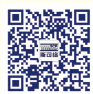
斯克络压缩机官方微信二维码